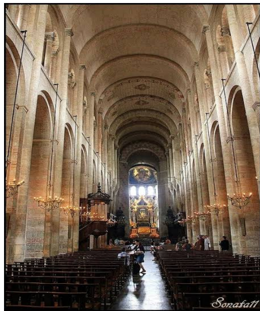
Basílica de Saint-Sernin (exterior e interior) Toulouse - França