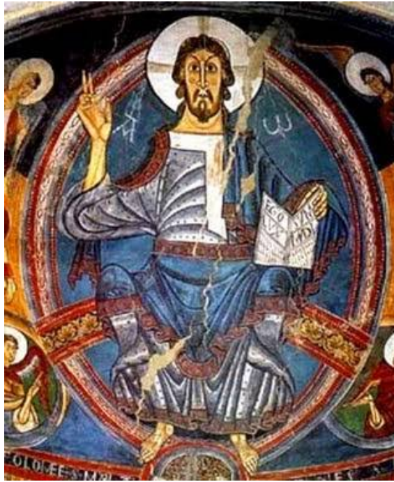
Cristo em Majestade (1123). Mestre de Tahul. Igreja São Clemente de Tahul