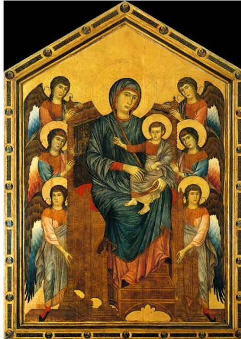
A Virgem e o Menino Rodeado de Seis Anjos (1300). Cimabue